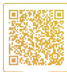
Чат детских и подростковых гинекологов