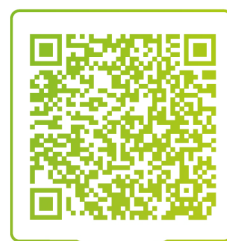
Чат специалистов ГиШ