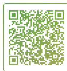
Чат детских врачей